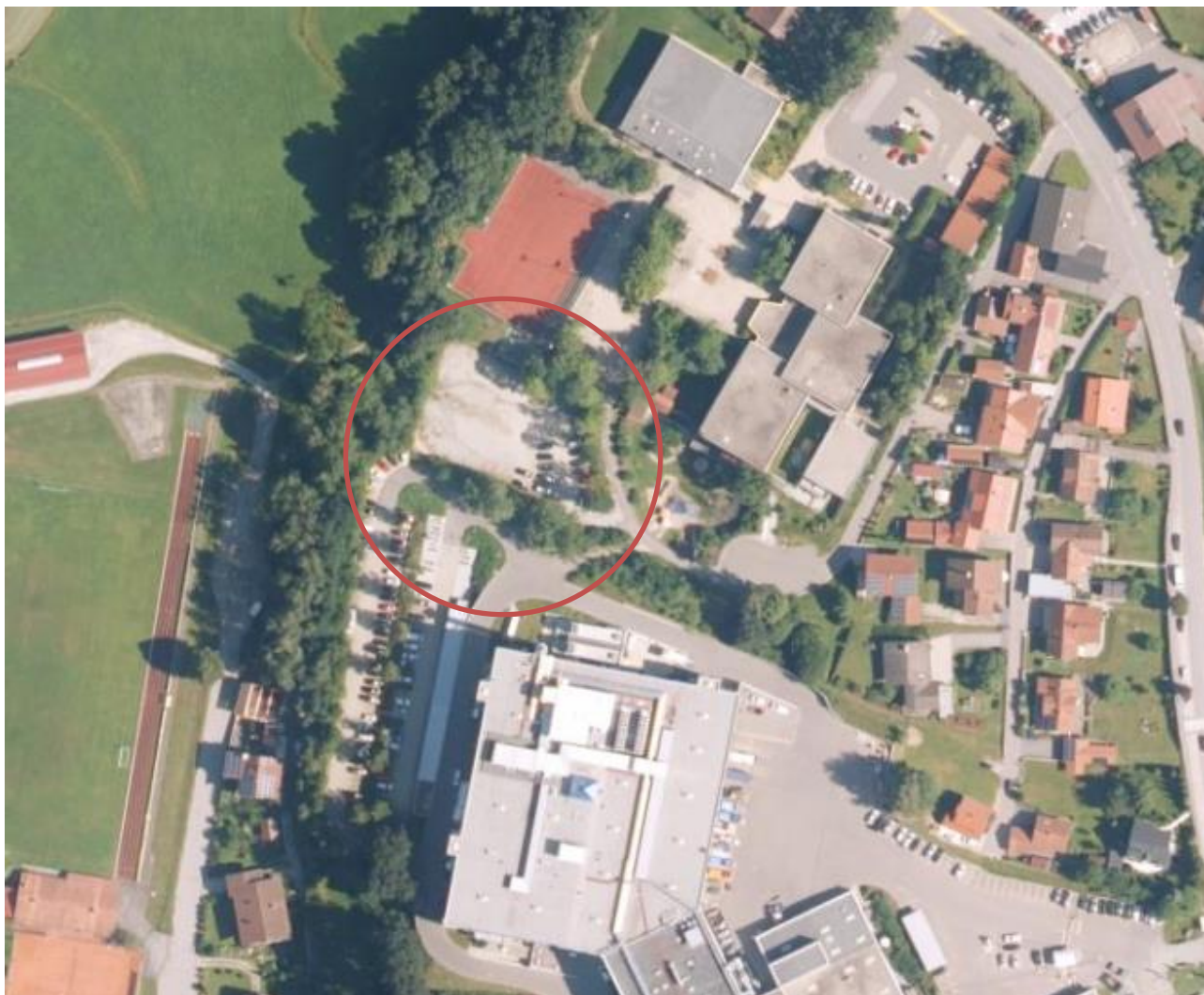
Abb. 1: Übersicht Planungsgebiet (Auszug Bayern-Atlas)

Das Planungsgebiet befindet sich südlich des Hauptortes in unmittelbarer Anbindung an das bestehende Sondergebiet im Nord-Osten und dem Gewerbegebiet „Hundsrück“ im Süden. Im Westen schließt an das Plangebiet eine Grünfläche an.