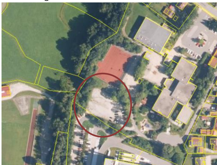
Abb. 6: Auszug aus dem Bayerischen Denkmal-Atlas

Im Geltungsbereich selbst befinden sich keine Denkmäler