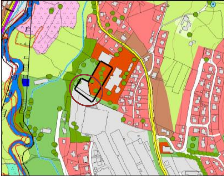
Abb. 2: Ausschnitt aus dem derzeit rechtswirksamen Flächennutzungsplan (ohne Maßstab)

Im derzeit rechtswirksamen Flächennutzungsplan des Marktes Teisnach ist der Geltungsbereich der Deckblattänderung als Gewerbefläche ausgewiesen.