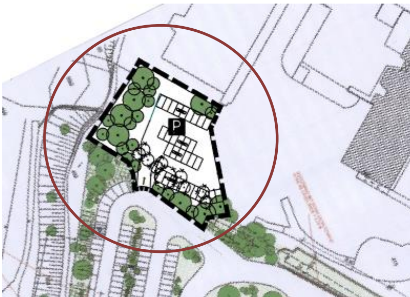
Abb. 3: Ausschnitt aus dem derzeit rechtswirksamen Bebauungsplan (ohne Maßstab)

Der rechtskräftige Bebauungsplan „Hundsrück“ Deckblatt Nr. 10 sieht, wie den nachfolgenden Abbildungen zu entnehmen ist, die Nutzung als Parkfläche vor.